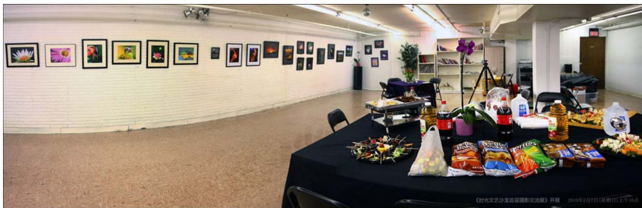
《时光文艺沙龙第一届摄影展展厅》

第一届影展订在二月六日(星期六),结果是赶上了费城罕见的大雪,电停路封,只好改在了二月七日。路是通了,但有些地方还是要趟过没膝的深雪。影展是在一家超市(家源超市, Exton, PA)的楼下,或者称为地下室的地方。厅很大,很整洁,刷着白色的墙,打着柔和的光。墙上挂着五十余幅,镶在黑色相框内的四位业余摄影家的作品。